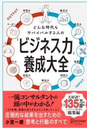
どんな時代もサバイバルする人の「ビジネス力」養成大全 小宮 一慶/著

植物を観察・採集するために日本各地を訪れた、日本の植物学の父・牧野富太郎。幼少期の思い出、植物を追い求めて遭難しかけた話など、山と植物にまつわる35のエッセイを選出。エッセイに登場する山のデータも掲載する。