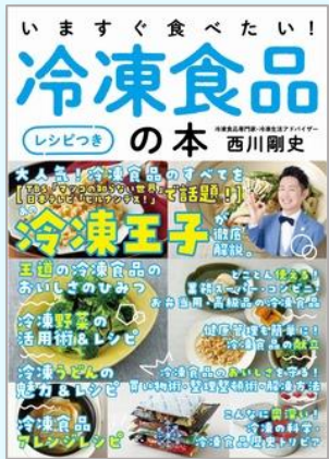
いますぐ食べたい! 冷凍食品の本 西川 剛史/著

王道の冷凍食品のおいしさの秘密から、冷凍野菜・うどんの魅力、冷凍食品の正しい買い方・包み方、冷凍の科学、歴史トリビアまで、楽しくて役立つ冷凍食品の情報を紹介する。レシピも多数掲載。