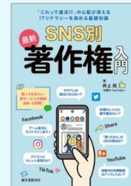
SNS 別最新著作権入門 井上 拓/著