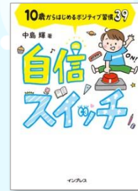
自信スイッチ 中島 輝/著

ガチガチの体をほぐしてしなやかな体に変えるには、「ねじる×伸ばす×呼吸」で硬さの要因になっている部位を正しい位置にチューニングする「バレエ・ストレッチ」を紹介する。体験談、悩み別バレエ・ストレッチ処方箋も収録。