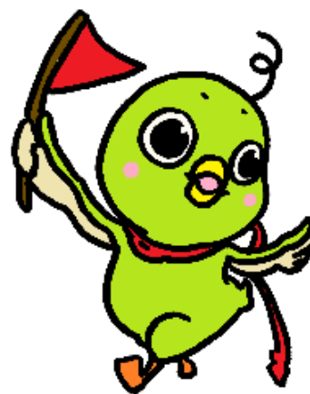
徳島市立図書館 キャラクター ひよタン