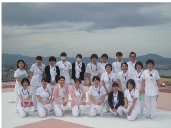
ヘリポート 今日初日 がんばるぞー！！

4月に行われた新人研修風景です。当院では知識・技術とともに、屋上（ヘリポート）から地下までの院内オリエンテーションを行っております。