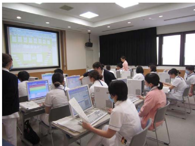
PC研修がんばろうーっと