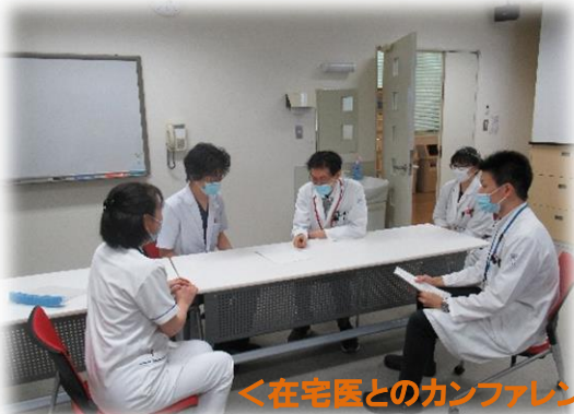
＜在宅医とのカンファレンス＞