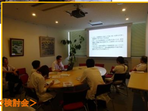
＜多職種チームで検討会＞