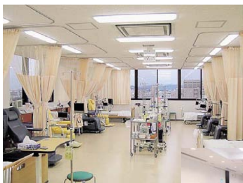
▲4階の化学療法室 （ベッド数を増床）