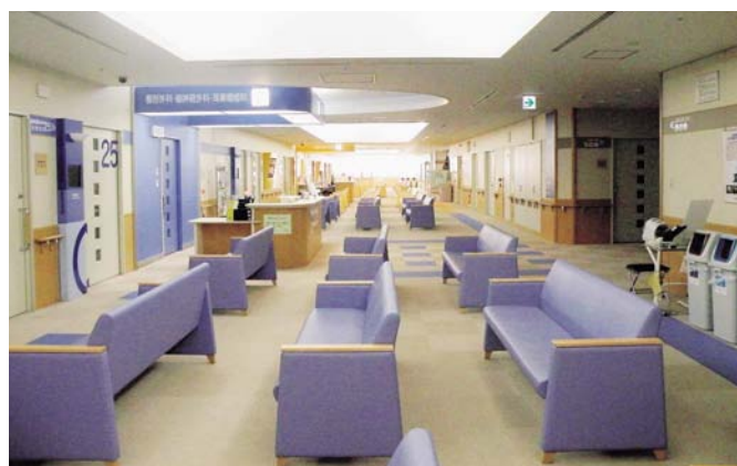
▲2階の外来（3階仮設ブースから眼科、小児科を移設）