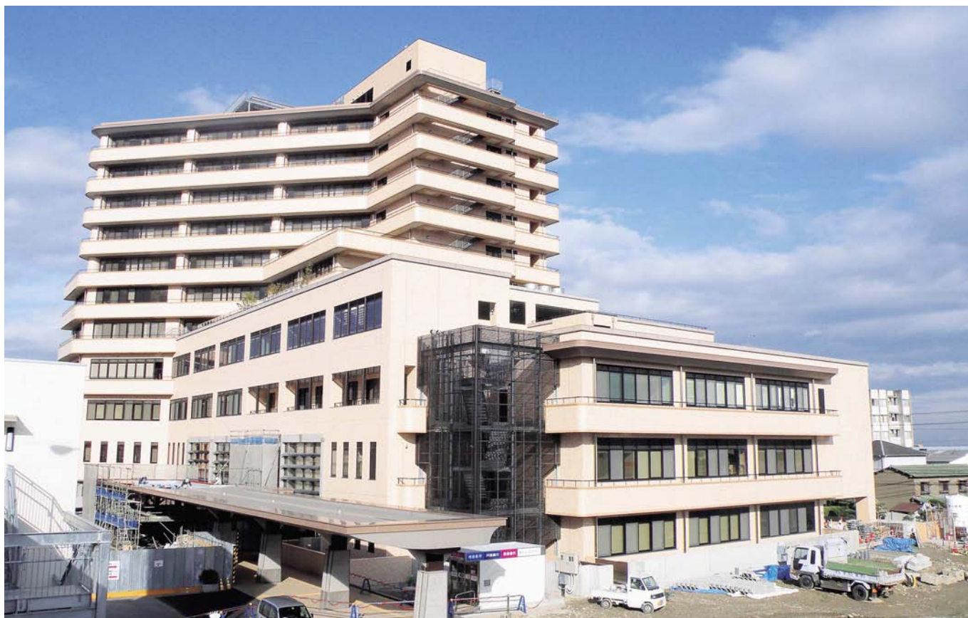
▲建物の工事が完了し、外構工事を残すのみとなった市民病院