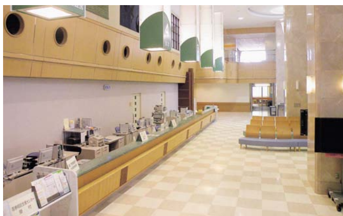
▲1階のエントランスホール（入院受付を増設）