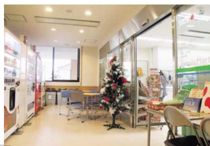
◀利用しやすくなった 売店（1階）