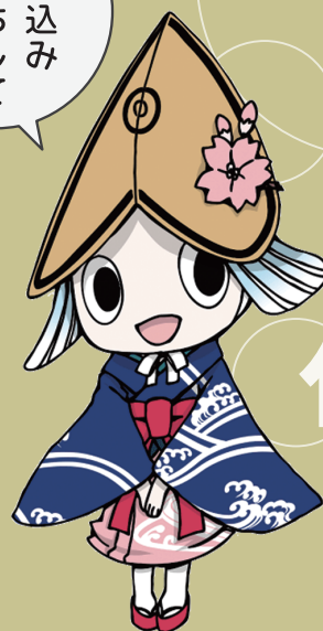
徳島市イメージアップキャラクター トクシィ

問い合わせ：徳島市役所 総務部人事課 088-621-5023 (平日 8:30~17:00)