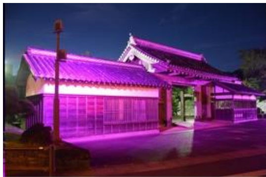
徳島中央公園 鷲の門