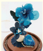
藍染花アレンジ高さ7センチ・ベース直径8センチ