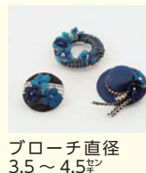
ブローチ直径 3.5～4.5センチ