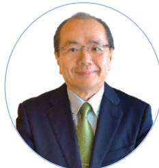
徳島市長 遠藤 彰良