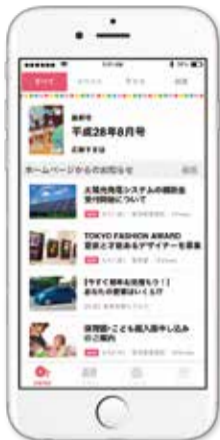
▲マチイロ イメージ画面

株式会社ホープが運営するアプリです。スマートフォンやタブレット端末で「広報とくしま」を見ることができたり、市公式ホームページの到着情報をプッシュ通知でお知らせしたりします。