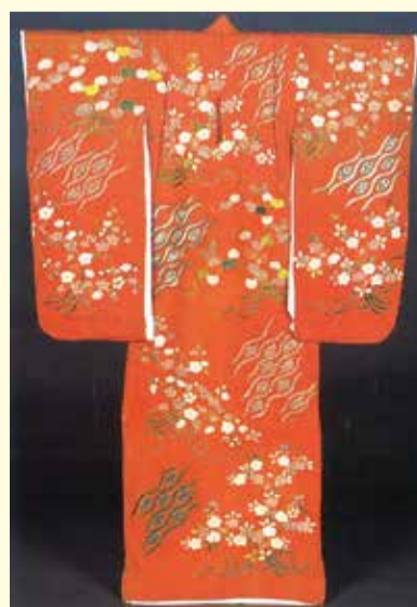
▲紅綸子地雲立涌桜葵花束模様産着