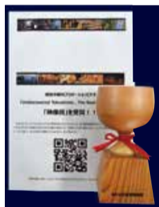
▲受賞トロフィー 「4K・VR徳島映画祭」

映像賞を受賞した本作品は、藍染めや食文化など徳島市の豊富な観光資源の魅力が詰まった作品で、認知度向上や観光誘客を図るために制作しました。文化・街・食・自然の4つの切り口で次々とシーンが切り替わります。また、主観的な視点を多く取り入れた映像手法が採用されており、見ている人が実際に旅をしている感覚を味わうことができます。