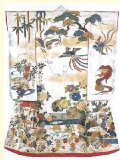
▲白綸子地能楽模様打掛