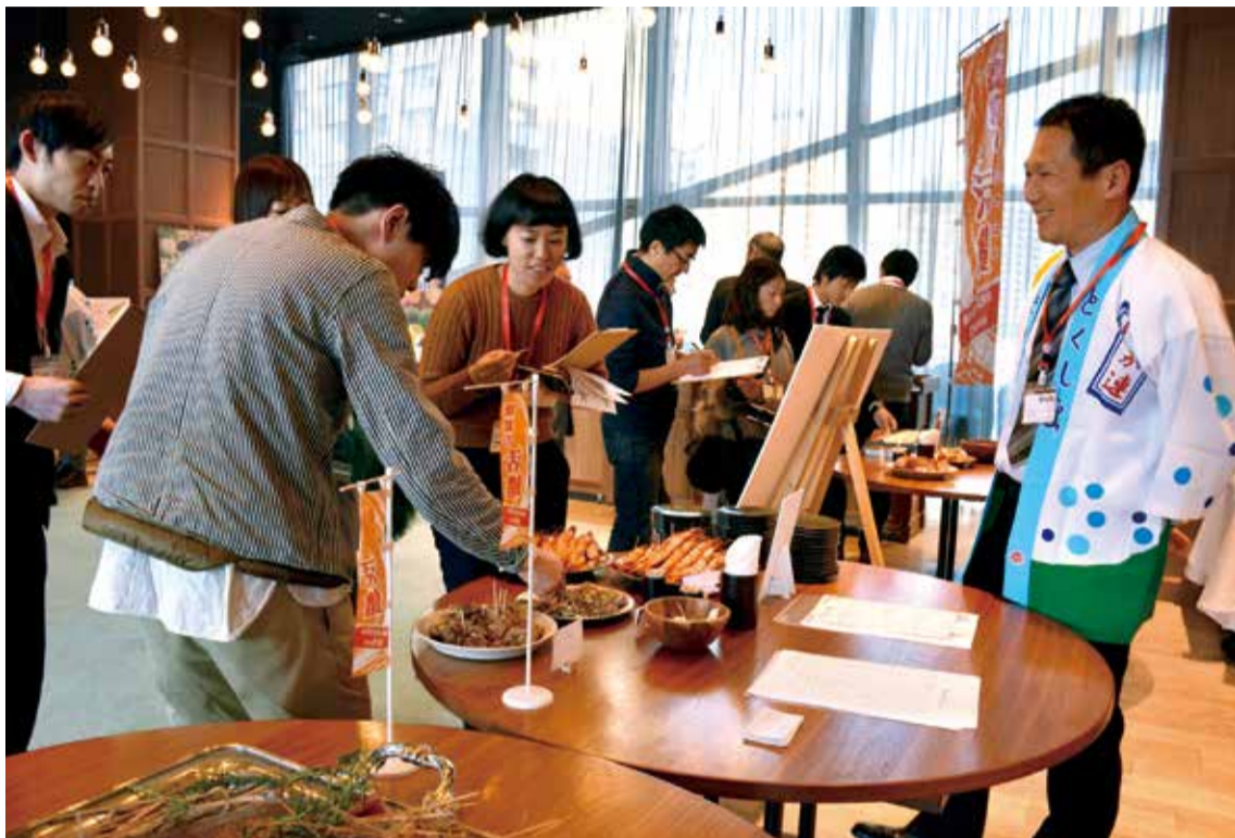
▲調理の仕方やおいしい食べ方を生産者に尋ねる事業者

徳島市産食材のプロモーション活動の一環として、東京港区赤坂にあるレストラン「CROSS TOKYO」で、1月25日に、本市の食材や加工食品などを紹介するイベント「うまいんじょ！とくしま」を開催しました。首都圏の食関連事業者や一般の消費者などに本市産食材の魅力や取り扱いに興味を持ってもらうのが目的です。