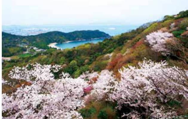
▲昨年度のデジタル部門1位作品「大神子公園からの眺め」

また、CDによる応募も受け付けます。CDによる応募の場合は、応募用紙(市役所5階公園緑地課で配布。市ホームページからダウンロード可)に必要事項を書いて、画像データが記録されたCDとともに、郵送または直接、公園緑地課(〒770-8571 幸町2-5)へ。なお、提出され