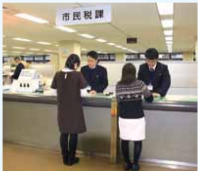
▲昨年度の申告会場 (市役所2階市民税課)