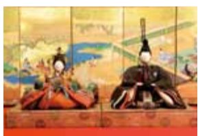
▲次郎左衛門雛 (徳島・個人蔵)

徳島に春の訪れを告げる徳島城博物館恒例の春の企画展「ひな人形の世界」を開催します。「ひな人形の世界」を「立雛」から「享保雛」「有職雛」「古今雛」「芥子雛」など、さまざまな様式の変遷を通して雛人形の歴史を振り返ります。す。丸い頭と細かく引かれた目、小さな鼻、おちよぼ口が特徴の