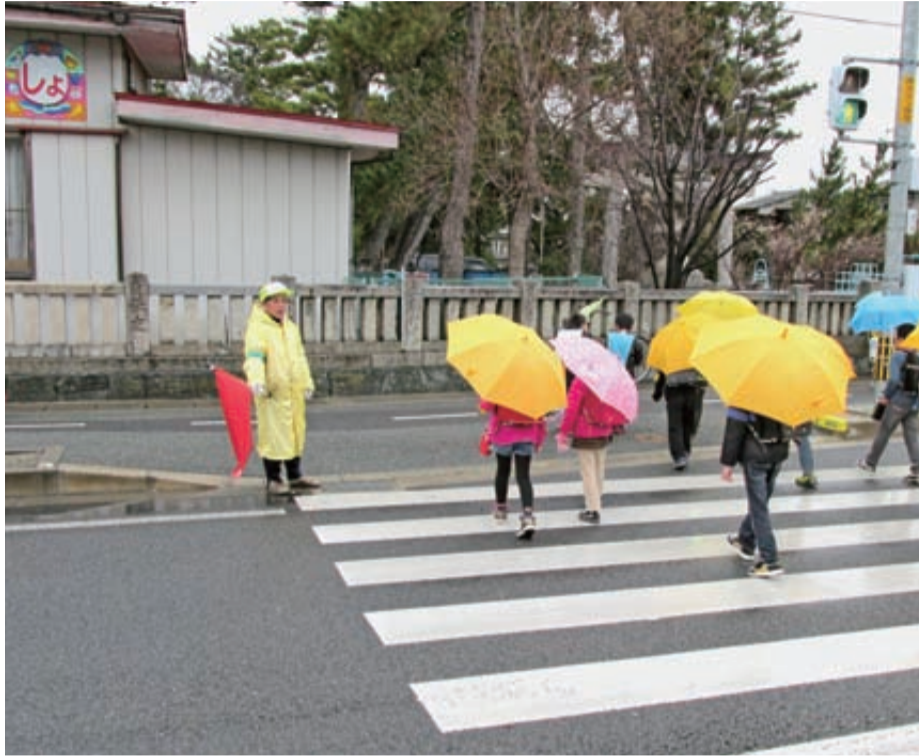
▲下校時の子どもたちを見守る地域の人

最も件数が多いのは「声かけ」ですが、全体に占める割合は減少傾向にあり、「接触」や「露出」など悪質なものの割合が増加傾向にあります。また、時間帯としては登