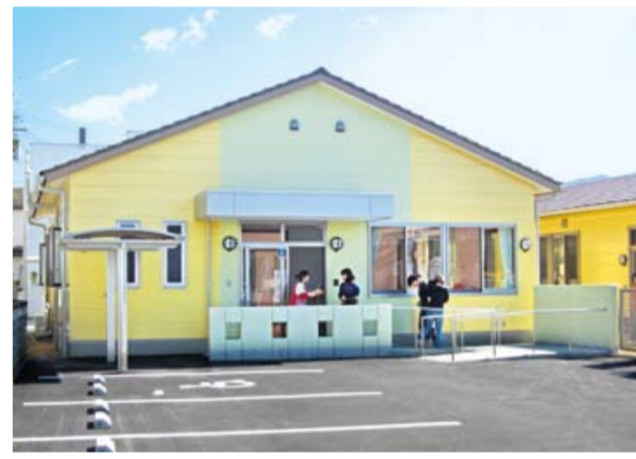
▲国府保育所の増改築を実施 ▷子育て環境の充実に向けて、乳児保育を開始(4月)、▷国府在宅育児家庭相談室を開設(10月)