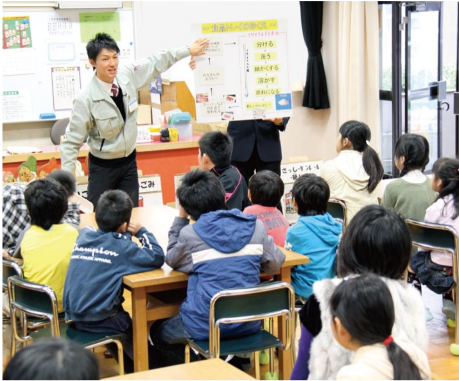
▲出前ごみスクールでリサイクルについて説明する市職員とその話に聞き入る児童(北井上小)

環境・ごみなど暮らしに身近な話題から市政に関するものまで多種多様な講座を用意していますので、学校の授業やグループの集まりなど、さまざまな場面でご利用ください。