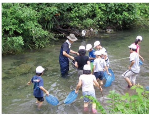
▲出前環境教室で水生生物を観察する子どもたち