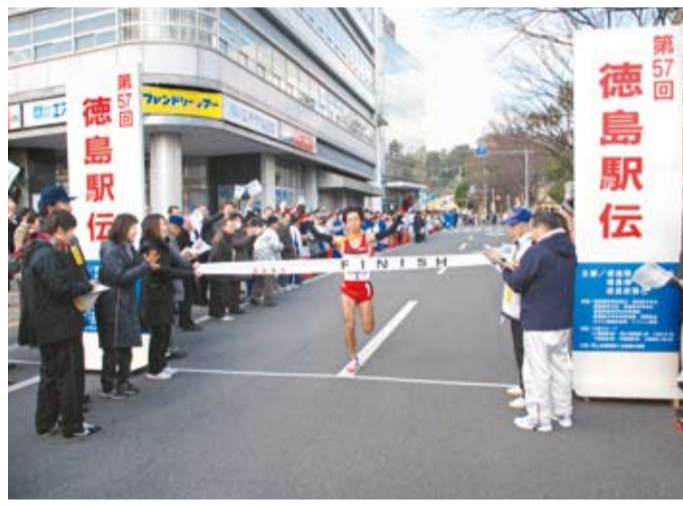
▲徳島駅伝、17度目の栄冠を完全制覇で飾る(1月) 第57回徳島駅伝において、徳島市は総合成績14時間37分25秒の記録で、2年ぶり17度目の優勝を果たしました。