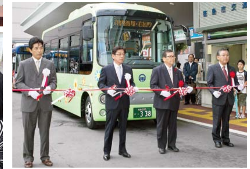
▲徳島市営バス路線再編、川内・東部・南部の循環線3路線を新設(10月) 市バスは、循環線を3路線新たに運行するなど路線の見直しと全面的なダイヤ改正を行い、利便性を高めました。