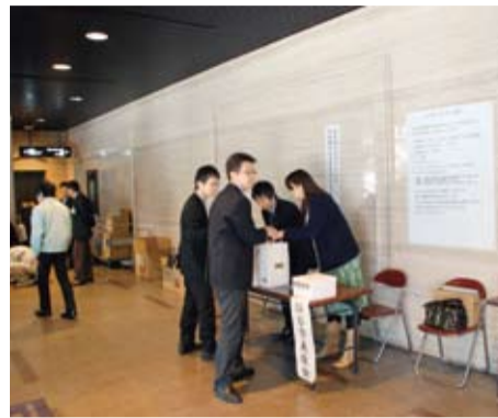
▲東日本大震災被災地を支援 ▷観光姉妹都市仙台市へ救援物資を提供(3月)▷義援金1,480万円送る(～8月)▷医療職員、水道局職員、消防局職員、事務職員など延べ126人の本市職員を派遣(～10月)