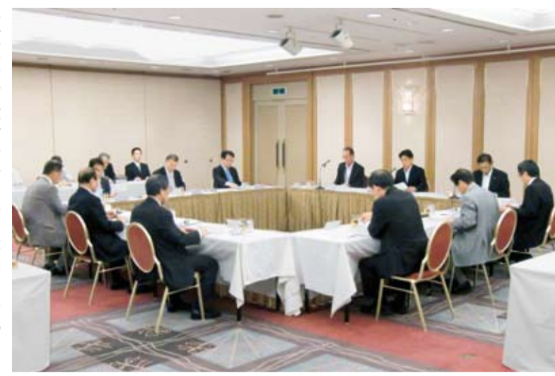
◀市民の安全安心を守る防災対策を推進 ▷秋田市(7月)鳥取市(9月)と相互応援協定を締結▷四国横断自動車道に設置する津波避難場所の基本協定を締結(8月)

2011年も残りわずかとなりました。市民の皆さんにとって、ことしはどんな一年だったでしょうか。3月に東北地方太平洋沖地震が発生しかつて経験したことがない甚大な被害をもたらしました。徳島市では、被災地に対して職員派遣など可能な限りの支援を行ってきました。今号では、ことし1年を振り返り、市政の主な出来事をご紹介します。