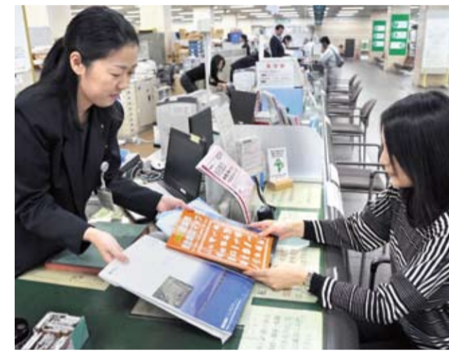
▲市民サービス向上のための取り組みを実施 ▷毎月第2・第4日曜日に休日窓口を開設(5月) ▷転入セットの配布(2月)