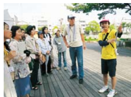
▲とくしま観光ガイドボランティアの活動風景

【支援の内容】▽協働チャレンジコースⅡ事業費の9割以内を補助(上限10万円)▽協働推進コースⅡ事業費の8割以内を補助(上限50万円) 【補助金総額】両コース合わせて総額220万円 【応募資格】市民活動団体のうち、団体運営に関する会則があり、市内で6カ月以上(推進コースは1年以上)継続して活動し、5人以上のメンバーがいるグループ 【選考方法】応募書類と公開プレゼンテーション(6月末を予定)、協働の相手となる課からの意見