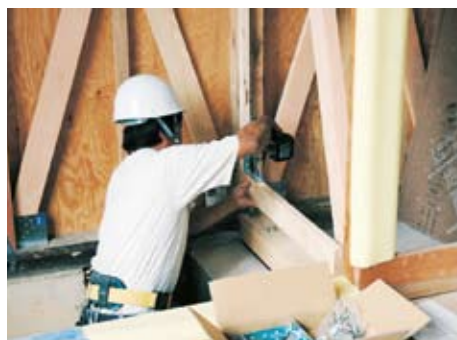
▲耐震改修工事の様子

【申し込みができる人】対象となる住宅の所有者。ただし、借家の場合は居住者の同意が必要です。