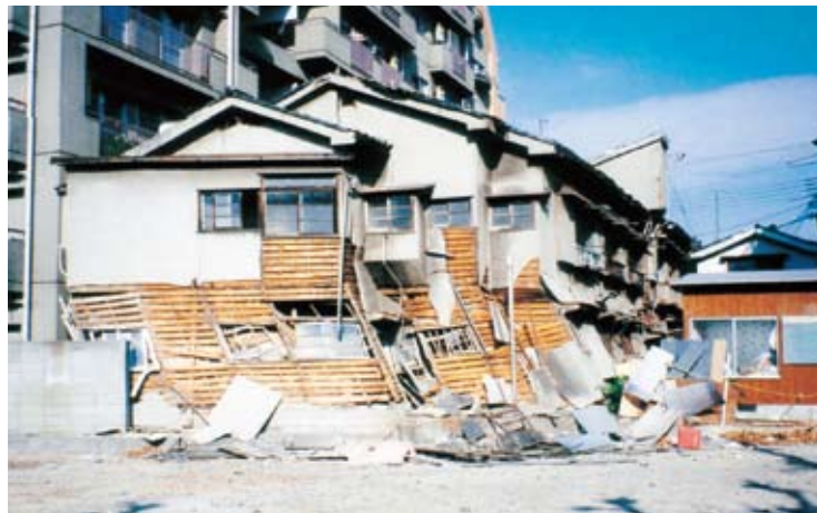
▲阪神・淡路大震災で被害を受けた木造住宅の様子（兵庫県）