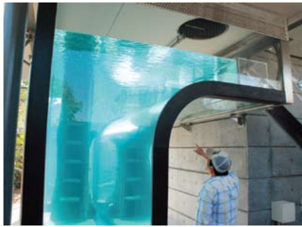
▲新築されたカワウソウ舎のプール。通り抜ける構造で、頭上に泳ぐカワウソウが見られることも。