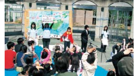
▲昨年の協働支援事業「楽しく学ぶ食育」のイベントの様子

徳島市は、市民活動団体(ＮＰＯ法人やボランティアグループ)などが公益的な活動を行う民間非営利組織)との協働を推進するため、「徳島市協働提案事業支援制度」を実施しています。徳島市をもっと元気にするアイデアを、ぜひお寄せください。