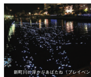
新町川に浮かぶあばたね(イベント)