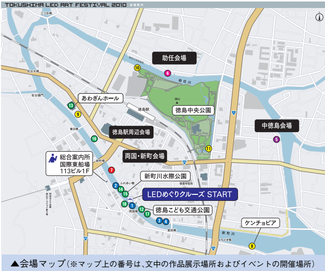
▲会場マップ(※マップ上の番号は、文中の作品展示場所およびイベントの開催場所)

(前月比) 人口 257,449人(-1,131) 男 122,186人(-672) 女 135,263人(-459) 世帯数 111,421世帯(-283) 面積 191.62km 2