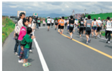
▲昨年のとくしまマラソンで沿道から応援する市民

ホームページでも紹介していますので、ぜひご覧ください。本年度、市民の皆さんやボランティア団体などから「とくしま市民遺産」を活用した事業を募集し、優れたものには事業費の補助を行います。