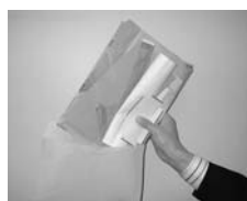
使用済みの封筒や紙袋に入れて