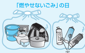
「燃やせないごみ」の日