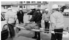
▲佐古地区での訓練の様子（2月）