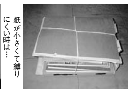
雑誌などと一緒にひもで縛る