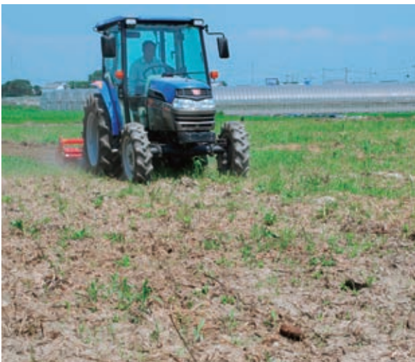
▲耕作放棄地を活用し、農業を再開しようとしている農地