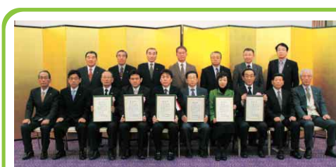
表彰企業代表者と推進協議会委員(12市町村長)