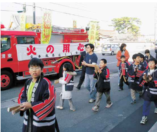
昨年の防火パレードの様子

(前月比) 人口 259,494人(+1) 男 123,365人(-30) 女 136,129人(+31) 世帯数 110,975世帯(+60) 面積 191.58km 2