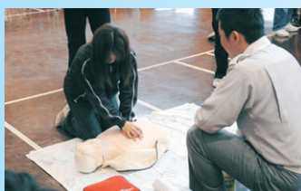
応急手当の実技講習会(東消防署)

徳島市消防局では、現場に居合わせた人による応急手当の実施が救命効果の向上を図るうえで重要であることから、市民の皆さんに対してさまざまな応急手当の普及啓発を実施しています。また、平成16年7月に、非医療従事者によるAEDの使用が認められたことに伴い、翌年9月1日からは、AEDの使用も含めた救命講習を実施し、さらなる普及を図っているところです。このたび、これらの応急手当の普及啓発事業の一環として、多くの人が集まる行事において、その参加者が心肺停止状態に陥った場合の救命活動に備えるため、次の①~⑤の条件を満たした人に対して、AEDの貸し出しを実施します。