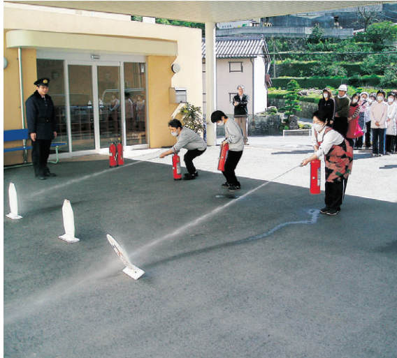
消火器の取り扱い訓練

住宅火災の主な出火原因は、「こんろ」13件、続いて「たばこ」5件、「火遊び」4件、「電灯・電話などの配線」2件、「放火」、「ストーブ」1件となつています。