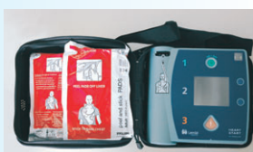
自動体外式除細動器(AED)

[問い合わせ・申し込み先] 徳島市東消防署 (☎656-1195)、徳島市西消防署 (☎631-0119)