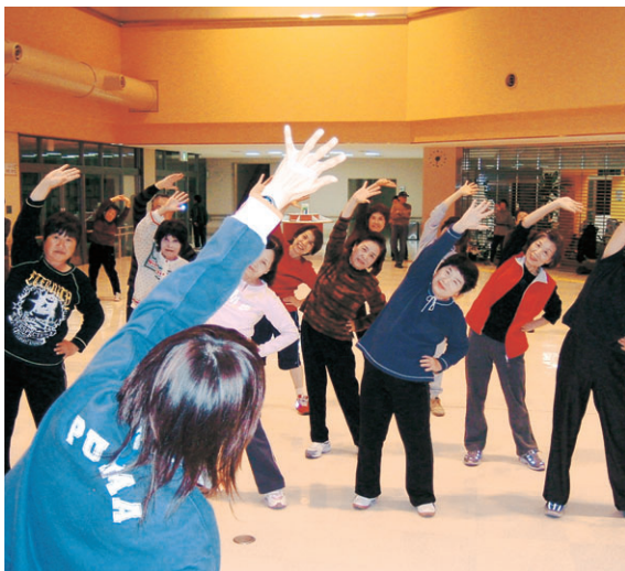
毎週月曜日、ふれあい健康館で開催しているさっか体操の様子

(前月比) 人口 260,466人 (+1) 男 123,912人 (+15) 女 136,554人 (-14) 世帯数 110,103世帯 (+87) 面積 191.39km 2