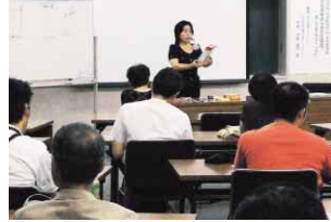
▲同ネットが主催した「地震対策家具転倒防止市民講演会」

「何事も当事者の意思や実践セミナーなどを通してボランティアの育成・派遣を行う予定です。活動はこれだけにとどまりません。中途難聴者のニーズを受けて、携帯に便利な筆談ボードを2年かけて開発。今年11月には、参加者