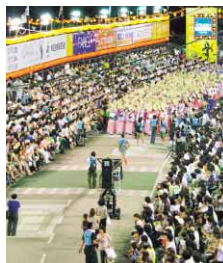
▲南内町演舞場での撮影風景

トに演じてもらえると、観客も楽しませられる。徳島の人々の期待に応えたいという作品にしたい」とあいさつ。