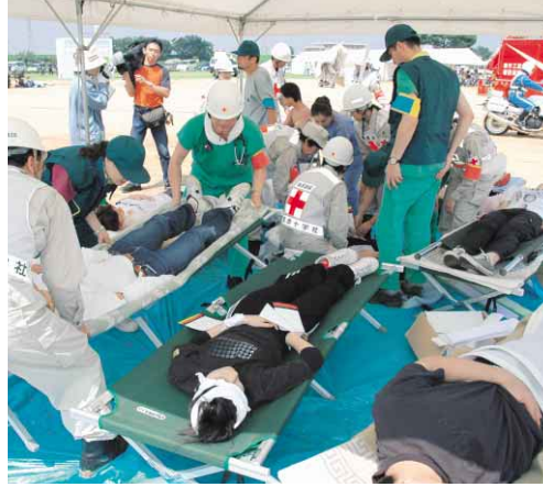
災害に備えて、防災訓練を行っています。(昨年9月鮎川河川敷)

わが家の防災対策 突然に襲ってくる災害に備えて、日ごろからの準備が大切です。 ■住宅の耐震性を調べる 阪神・淡路大震災において死亡した人の約8割が、住宅の倒壊によるものと推定されています。建物の耐震性を調べ、問題があれば補強などの対策をしましょう。 ■家具を固定する 家具や食器棚を転倒防止金具などで柱や壁に固定しましょう。 ■非常持出袋を準備する 水や食糧、懐中電灯、ラジオなどをリュックにまとめ、すぐに取り出せる場所に置いておきましょう。 ■消火用具を備える 地震による火災を防ぐために、消火器などの消火用具を備えましょう。 ■家族で話し合う 家族の役割分担や避難場所などについて家族全員で話し合い、防災意識を高めましょう。