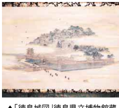
▲「徳島城図」徳島県立博物館蔵

が実際に車いすなどを乗り比べられる福祉機器展を開催予定です。これからの活動の幅はどんどん広がります。お問い合わせ先 阿波グローバルネット事務局 ☎(652)8019