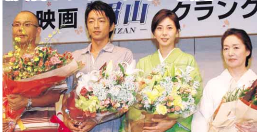
▲会見に臨む大童監督、大沢さん、松嶋さん、宮本さん(左から)

00人を超えるエキストラやボランティアの皆さんに参加していただき、クライマックスシーンの撮影を終えることができました。