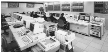
徳島市消防局の通信司令室

みなさんの周りで、火事が起こったり、急病や突然のケガで困っている人がいたら電話で「119」番をかけて、消防車や救急車を呼ぶこととなります。徳島