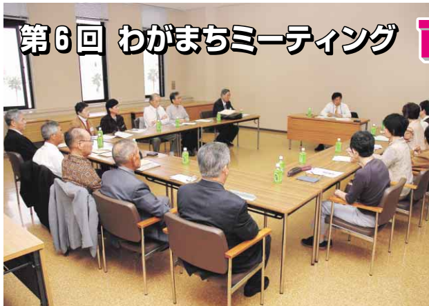
それぞれの熱い思いが語られました(10月14日)

わがまちミーティング「市長と一緒に熱々トーク」は、市民の意見を市政に生かすために、さまざまなグループの皆さんと原市長が、市政や地域の課題などをテーマに自由に話し合うもので、昨年9月に始まり、今回で第6回目となりました。このトークの概要をお知らせするとともに、今までのトークを振り返ります。