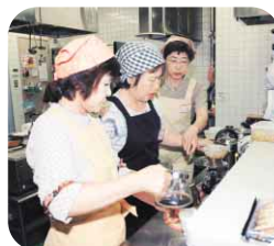
とくしま語り場で働く皆さん

また、高齢者の安全という観点から、徳島市消防団OB会の皆さんは、培った経験を地域のために生かし、「防災マップは、一般の人にはわかりにくいことも。相談があれば、避難場所など、その人の家を基点にして説明したい」と大規模災害の時には、地域での助け合