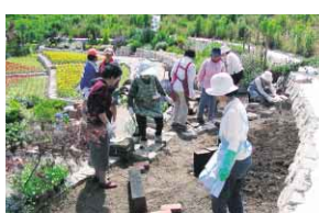
庭づくりの基礎を学ぶ昨年の参加者

「参加費 無料」 【申し込み方法】往復はがきに講座名、代表者の住所名前年齢電話番号、参加者全員住所名前年齢、返信先あて名を記入の上、11月14日(月)必着まで、とくしま植物園緑の相談所(〒771-4267 洪野町入道45-1)へ。