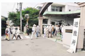
津波避難訓練の様子

波の到達までに浸水予測地域外に避難することが困難な地区。避難対象地区のうち、昭和、渭東、沖洲、津田、川内地区の一部が該当地区として示されています。 ■避難所II津波避難計画で指定している津波による浸水の恐れがない建物47カ所のほか、津波避難の対象とならない地区のマップには地震対応の避難所が示されています。 津波避難対象地区でない人も、マップに載っている地震に対応した避難所、重要な道路などを参考におきましよう。また、山間部を中心に、急傾斜地崩壊危険区域、土石流危険渓流なども記載していますので、ご確認ください。 いざという時に、迅速に避難するためには、日ごろからの備えが重要です。そのため、家具の転倒防止や非常持ち出し品の準備など家庭で取り組める身近な防災対策を掲載しました。 ▼あなたの家は安全ですか 地震の揺れにより倒れた家具や割れたガラスなど、けがをしたり、命を落とす可能性があります。 まず、あなたの家を点検してみましょう。家具の転倒防止などのポイントも掲載しています。 ▼避難所や避難方法、避難時の家族の役割、家族が離れ離れになった時の連絡方法など家族で決めておくこと役立つ事項を挙げました。 ▼避難の心得10か条 「避難には車を使用しない」など、避難する時のために覚えておく役立つ基本的な事項をまとめました。 ▼みんなで考える、避難所や避難方法 避難所や避難方法、避難時の家族の役割、家族が離れ離れになった時の連絡方法など家族で決めておくこと役立つ事項を挙げました。