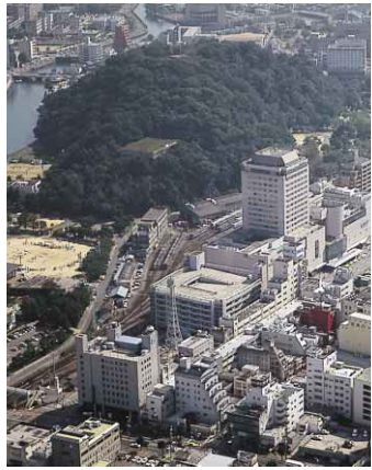
上空から眺めたJR徳島駅周辺の風景

れる自然環境の保全にも十分配慮したものになければならないと思っています。蟹の横歩きは、改めて、そのことの大切さを教えてくれた気がします。