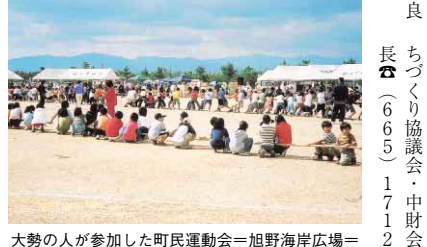
大勢の人が参加した町民運動会=旭野海岸広場=

「観光についての お問い合わせ先」 徳島市観光協会(622) 4010 / 観光課(621) 5232へ。