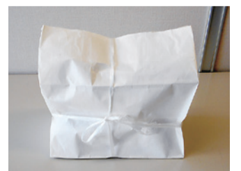
ひもで縛って、出しましょう。