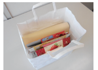
紙袋に入れて一時保管