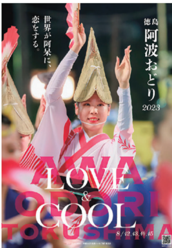
▲2023阿波おどりポスター

▶演舞場の車いす用観覧席チケットの購入方法などについては、阿波おどり未来へつなぐ実行委員会事務局までお問い合わせください。