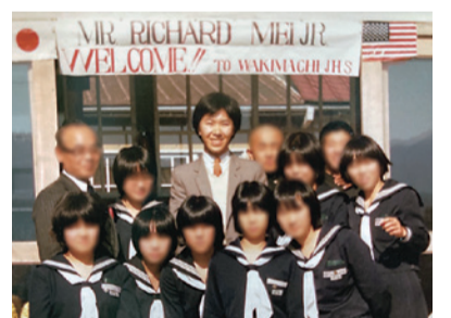
▲当時の総領事(後列中央) 徳島の生徒たちと

メリカと日本の強い絆をさらに深めていくことに貢献できるのは私の誇りです。徳島で過ごした経験のおかげだと思っています。