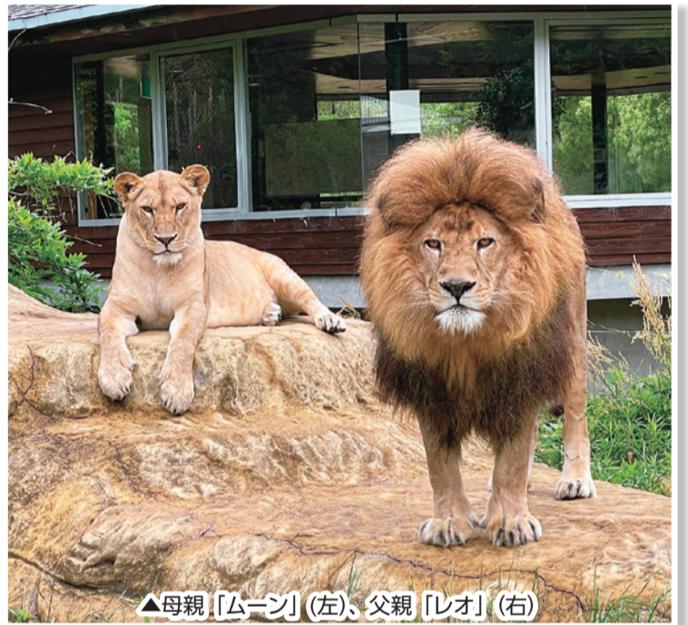
△母親「ムーン」(左)、父親「レオ」(右)

とくしま動物園北島建設の森に待望のライオンの赤ちゃんが誕生しました。8月に生まれたライオンたちは、母親「ムーン」に見守られ、すくすくと元気に育っています。11月8日(火)から一般公開を予定していますので、かわいい子ライオンたちにぜひ会いに来てください。