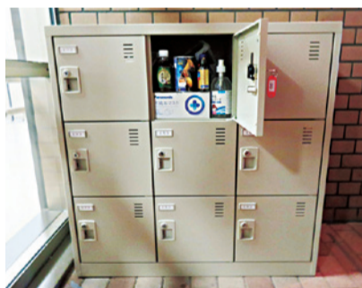
▲ふれあい健康館に設置されているロッカー