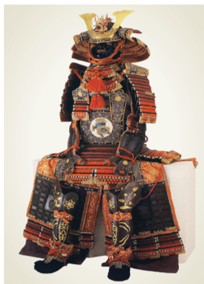
▲紫系威大鎧(市指定文化財) 阿波・淡路両国25万7千石の大名蜂須賀家の威容を示す豪華な大鎧 ※展示物は、定期的に展示替えを行っています。