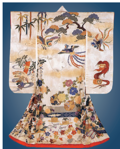
▲白紵子地能楽模様打掛 蜂須賀家の染織コレクションの一つ。鳳凰などが華やかな打掛