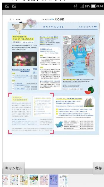
4 気になる記事はスクラップ