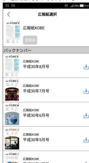
3 最新号だけでなくバックナンバーも