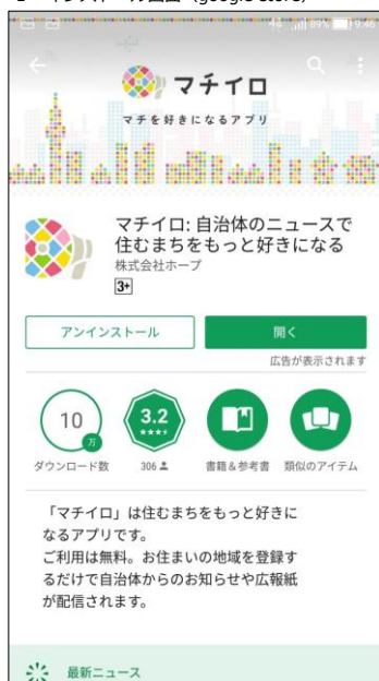
1 インストール画面 (google store)