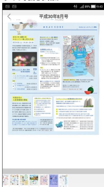
3 いつでも好きな時間に