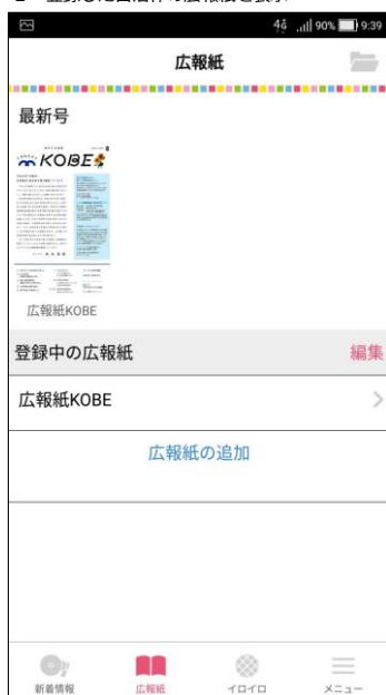
2 登録した自治体の広報紙を表示