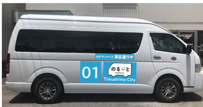
使用車両 (イメージ)

今回のシステム事業者が他都市で導入しているAIデマンド交通の愛称が「のるーと」であることから、本市における愛称を「のるーと徳島市」とする。