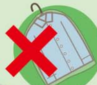
クリーニングの袋