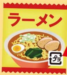
インスタントラーメンの袋