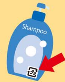
シャンプーのボトル