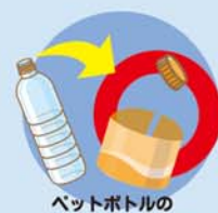
ペットボトルのキャップとラベル