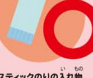
スティックのりの入れ物