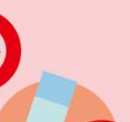
ゲームソフトのケース